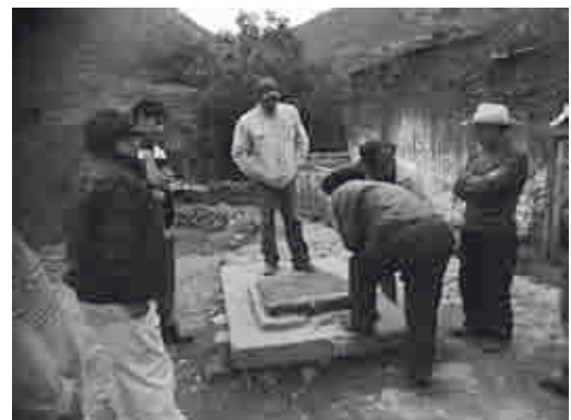
Autoridades locales y pobladores reunidos con la empresa constructora para buscar soluciones. Año 2012