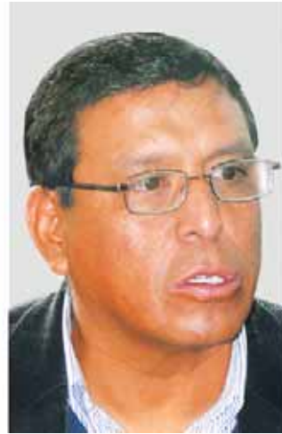
Alfonso Atanasio Carvajal