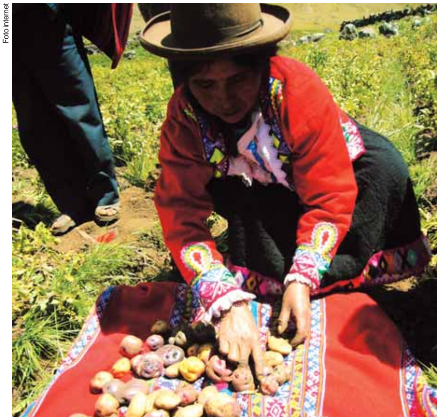
Las comunidades indígenas han sido los principales conservadores de las variedades nativas. Las leyes deben proteger el derecho de los pequeños agricultores a manejar y acceder a las semillas.

pecies comprendidas en el derecho del agricultor de acuerdo con su realidad nacional, regional o local.