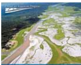
Cambio Climático, Migración y Conflicto en la Amazonía y en los Andes El Sumario de Inocencia y los Desafíos de Política Pública en Latinoamérica Instituto de Estudios Peruanos - IEP

Este informe es el cuarto de una serie del Center for American Progress (Centro para el Progreso Americano), que examina las implicaciones del nexo entre el cambio climático, la migración y la seguridad. Estos análisis subrayan el entrecruzamiento de esos factores en regiones estratégicas del mundo y sugieren maneras mediante las cuales las políticas públicas de EE.UU. deben adaptarse para responder a los desafíos presentados por ellos. Texto descargable desde < http://www.americanprogress.org/wp-content/uploads/2013/07/SPANISH_SouthAmericaClimateMigration.pdf >.