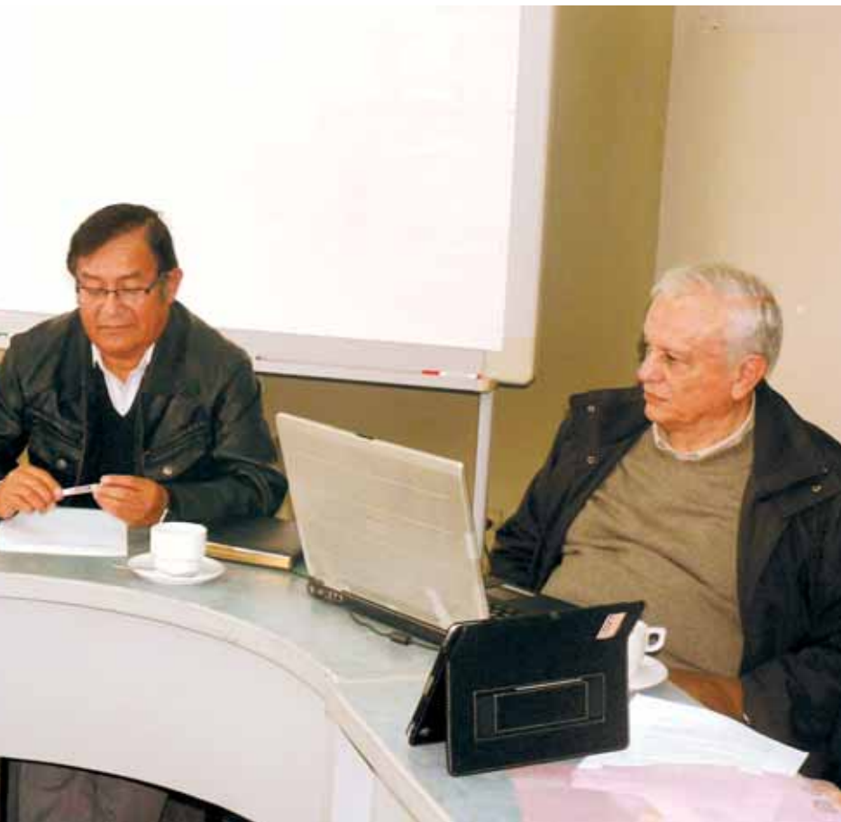
acerca de los recientes resultados del Censo Agropecuario sobre la población de camélidos. Estas