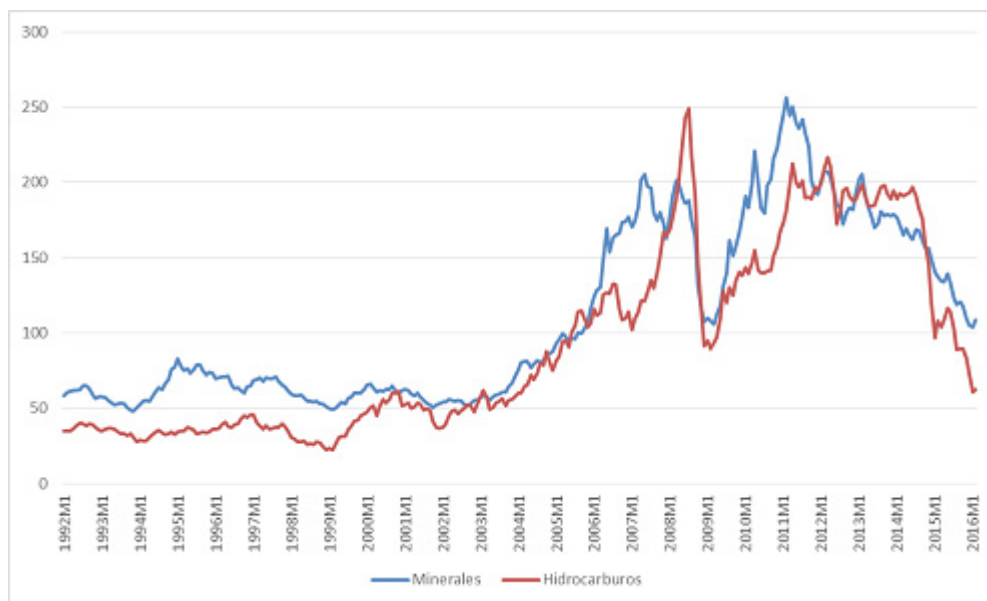
Índice de precios de los minerales e hidrocarburos Año 2005 = 100

Entre 2004–2013, cuando los precios de los minerales, petróleo y gas natural registraron incrementos muy por encima de los años anteriores, éstos se tradujeron en importantes ingresos para el Estado peruano y en la posterior transferencia de recursos hacia las zonas de extracción de los recursos naturales, es decir por canon. Sin embargo, los precios de los minerales (desde el 2012) e hidrocarburos (desde el 2014), empezaron a disminuir, con perspectiva a seguir a la baja los próximos años. Ver gráfico a continuación.