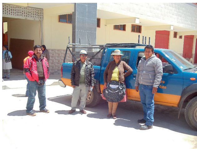
Miembros del Comité de vigilancia reuniéndose con los representantes de Electro Sur Este, empresa responsable de los medidores de energía eléctrica.