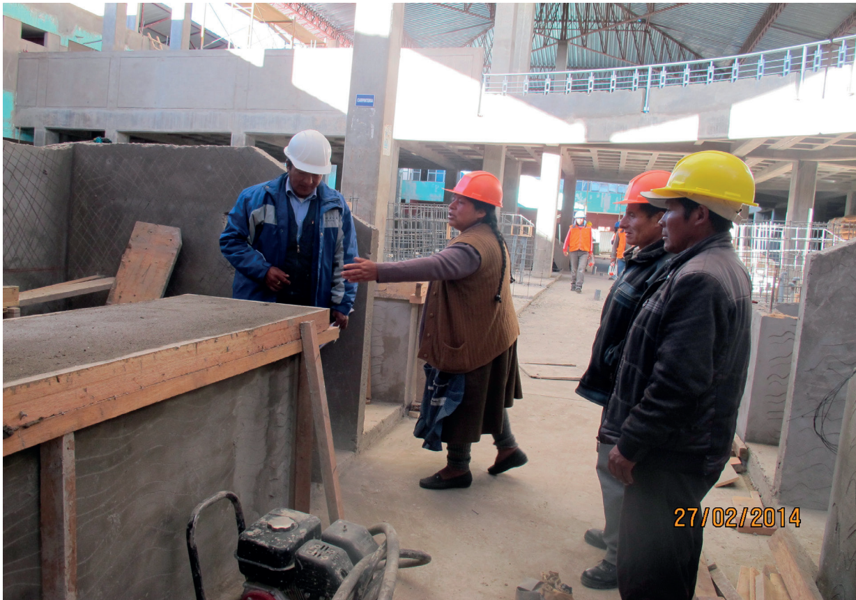
Miembros del Comité de Vigilancia en visita inopinada a las instalaciones de la obra del Mercado, junto al arquitecto responsable de la obra