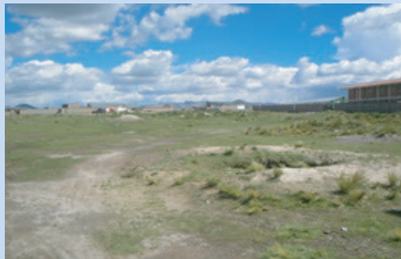
Espacio destinado para la construcción del coliseo de Espinar en el pueblo joven Belén. Abajo maqueta que muestra el diseño del coliseo