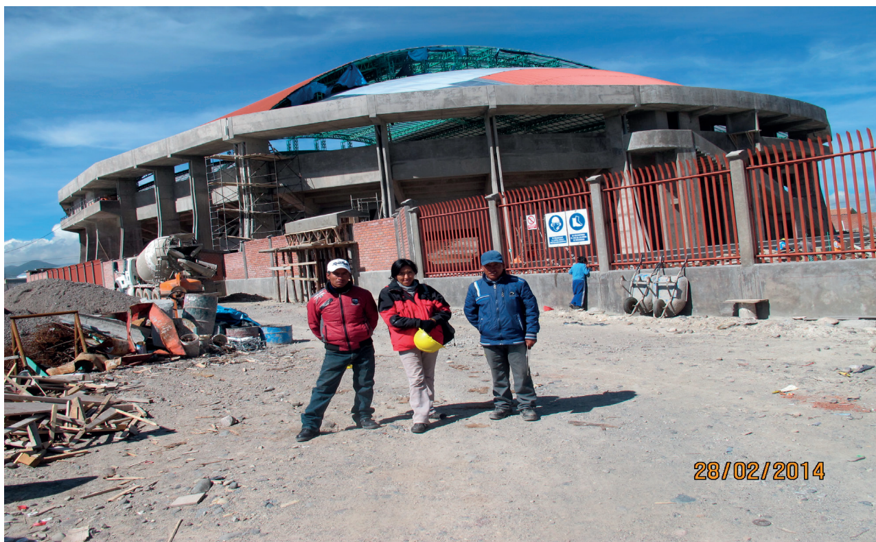
Coliseo en construcción. Febrero del 2014.