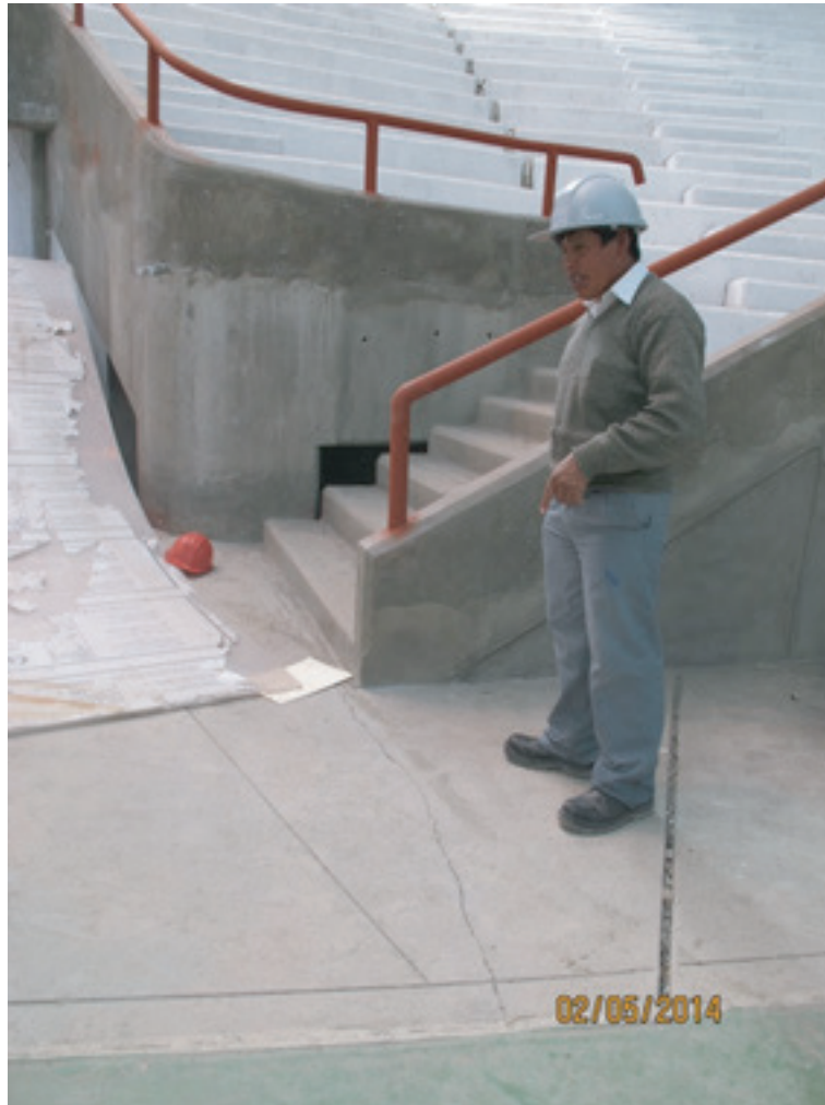
Presidente del Comité mostrando las fisuras halladas en las graderías y veredas externas del coliseo. Fisura en las bermas externas del coliseo