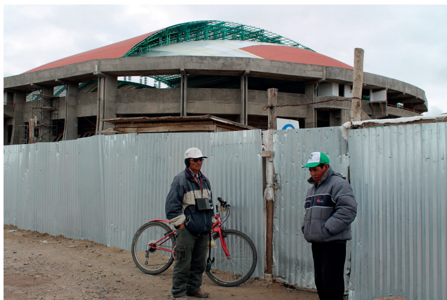
Guardián de la obra negando el ingreso a la obra al Presidente del Comité de vigilancia de obra.