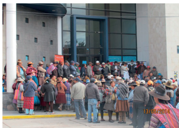
Martes 13 de mayo de 2014. Visita de los comerciantes del mercado a las instalaciones de la Municipalidad de Espinar. Manifestaron su malestar por la demora y cambio constante de gerentes, lo que dificultaba el avance de la obra.