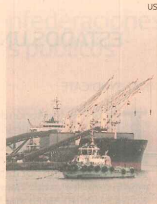
Flotas. Retornaron al puerto.

Frente a esta situación, la flota de las empresas asociadas al gremio pesquero decidió volver a puerto y anclar hasta que mejoren