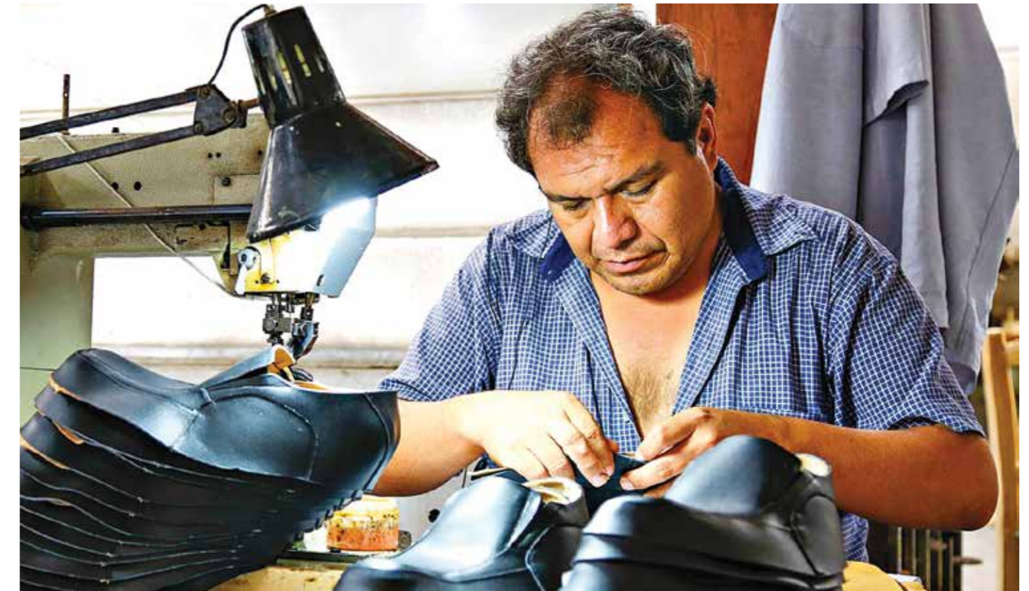
LAS MYPES ESTÁN ENTRE LA VIDA Y LA MUERTE Y EL PROGRAMA NO LAS AYUDARÁ, PERO AÚN HAY TIEMPO DE CORREGIRLO. DE LO CONTRARIO, EL PLAN FUE DISEÑADO PARA OTROS FINES.

Este es un indicador de la preferencia de las entidades financieras por colocar créditos a la mediana y gran empresa, por el menor riesgo y costo que implican. En contraste, los créditos a las Mypes tienen un mayor costo operativo y mayor riesgo, que se reflejan en una tasa de interés mayor. La baja proporción de re-