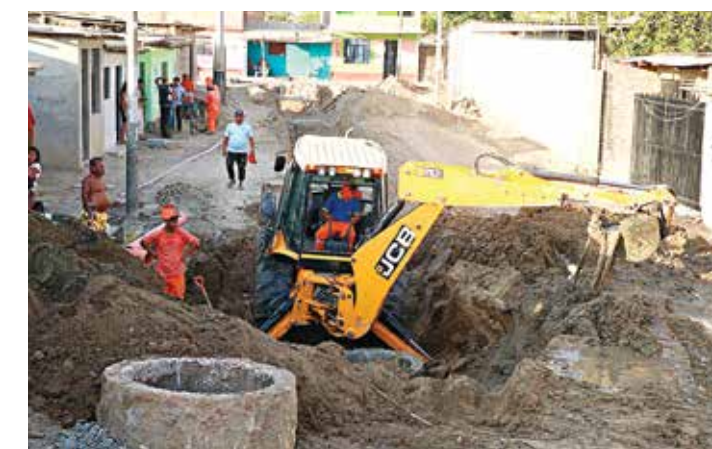
A LA EX AUTORIDAD DE LA ARCC, CHUI LE INTERESÓ MÁS LAS OBRAS PEQUEÑAS Y DE GOBIERNOS MUNICIPALES.

En el caso de la última, las dificultades de restituir la infraestructura de salud -de primordial importancia para la provisión de servicios públicos en medio de la emergencia sanitaria, ha llevado a que este tipo de inversiones ingresen de manera preliminar a los paquetes de intervenciones que podrán ser ejecutadas bajo la modalidad Gobierno a Gobierno. ©