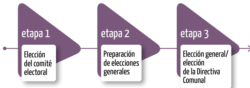
Gráfico N.º 1. Etapas del proceso electoral comunal

El proceso electoral comunal comprende tres etapas que se deben seguir paso a paso, preparando los documentos de manera ordenada.