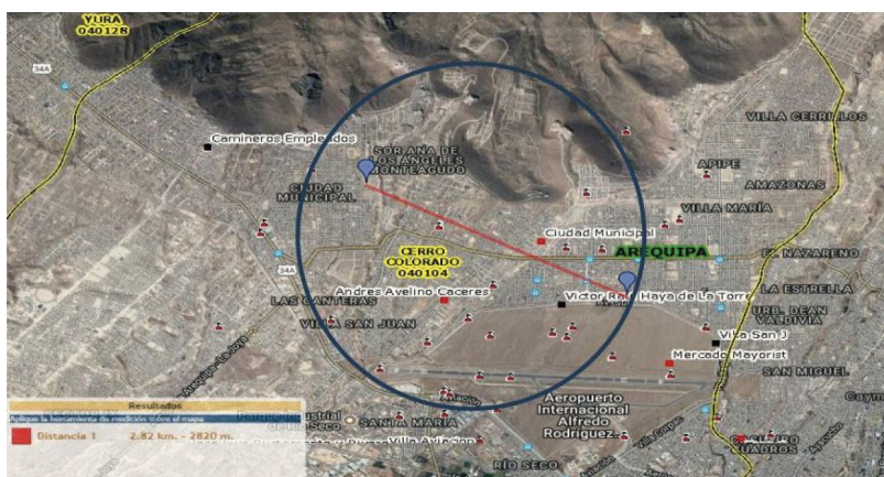
Gráfico 01: Institución educativa de nivel secundario ubicada dentro del área del proyecto

Por lo que según la oferta-demanda, elaborada por la Gerencia Regional de Educación, en un radio de influencia existen otras instituciones educativas públicas del mismo nivel (las instituciones educativas dentro del radio de influencia pertenecen a CIRCA (colegios católicos) y no cuentan con mayor infraestructura para albergar a nueva población estudiantil.