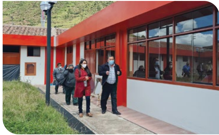
Visita de la congresista Ruth Luque al Centro de Rehabilitación y Capacitación de Ccorao (febrero de 2022).