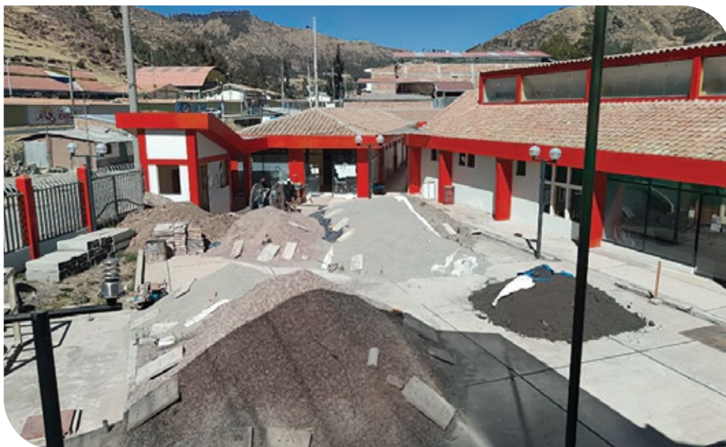
Constatacion de los materiales de construccion en la obra paralizada (28 de julio de 2022).

La situación del proyecto de construcción de infraestructura para la atención y rehabilitación de las personas con discapacidad de la región Cusco es incierta después de más de doce años de su construcción física. Es decir, existe la infraestructura en un estado regular y su implementación se realiza muy lentamente, aunque cuenta con un avance financiero del 92.1% y un avance físico del 66.21% al mes de agosto de 2022. Para este año 2022 en conjunto se tiene programado un presupuesto de tan solo de S/ 685 178.00, el cual será insuficiente para la conclusión de la implementación del proyecto.