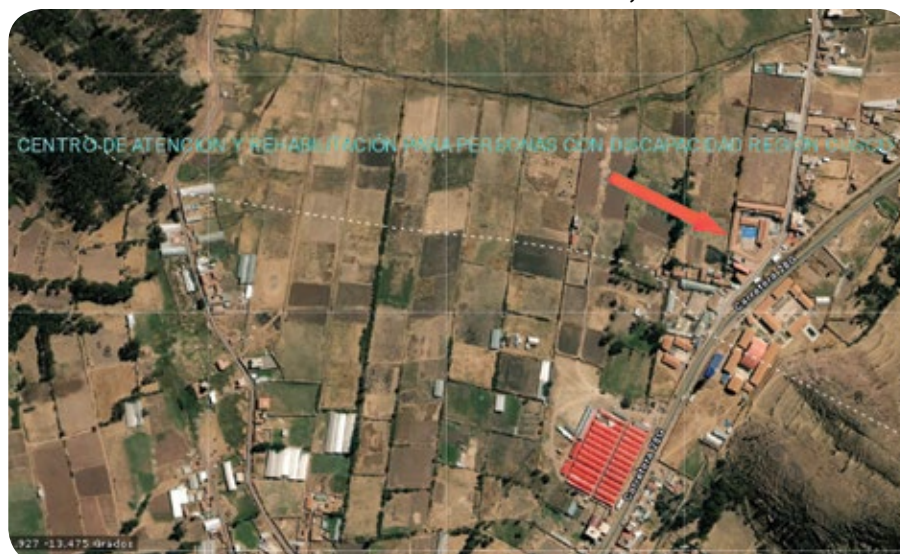
Ubicación del Centro de Rehabilitación, en Ccorao

La obra en ejecución está a cargo de la Gerencia de Gestión de Proyectos del GRC y su construcción se inició el 1 de mayo de 2009. Sin embargo, este proyecto no tiene cuándo ser culminado en su implementación, pues durante dos gestiones regionales (2011-2014 y 2015-2018) la obra estuvo totalmente paralizada. La gestión 2019-2022 retomó el proyecto, iniciando con su mantenimiento por la situación de deterioro en la que se encontraba la infraestructura. Actualmente, está en la etapa de implementación de los servicios básicos de agua, desagüe y electricidad, habiéndose encontrado inconvenientes en la instalación de agua y desagüe por la inexistencia de una red pública de estos servicios en la localidad. A meses de la finalización de la gestión regional, no se ve luces para que sea implementado para su puesta en funcionamiento.