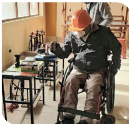
Visita de miembros de la Apdis (febrero de 2020).