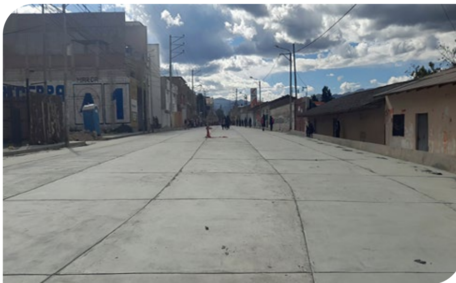
Vista de avance de la obra

“A partir de la vigencia de la presente norma y en los años fiscales subsiguientes, las entidades públicas de los tres niveles de gobierno están obligadas a registrar en el Sistema de Información de Obras Públicas (Infobras), a cargo de la Contraloría General de la República, información sobre la ejecución de obras públicas, conforme a lo que establezcan las normas que emita ese Organismo Superior de Control. Los titulares de las entidades son responsables de manera solidaria con el Jefe de la Oficina de Programación e Inversiones, o el que haga sus veces, del cumplimiento de la presente disposición, la misma que entra en vigencia al día siguiente de la publicación de la presente ley.”