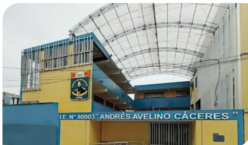
Vista del desnivel del cerco perimétrico de la IE Andrés Avelino Cáceres

Aprueba la ejecución de la prestación adicional de obra N° 5 por el monto de S/ 50 339.71 y el deductivo vinculante N° 3 por el monto de S/ 50 339.71 de la obra y por un plazo de ejecución de 18 días calendario, el mismo que se computará desde el día siguiente a la notificación de la presente resolución.