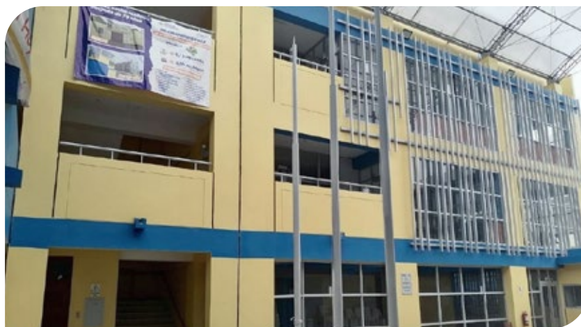
Parte derecha de la intervención de la obra en la IE Andrés Avelino Cáceres