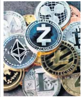
Regulación global a criptos.