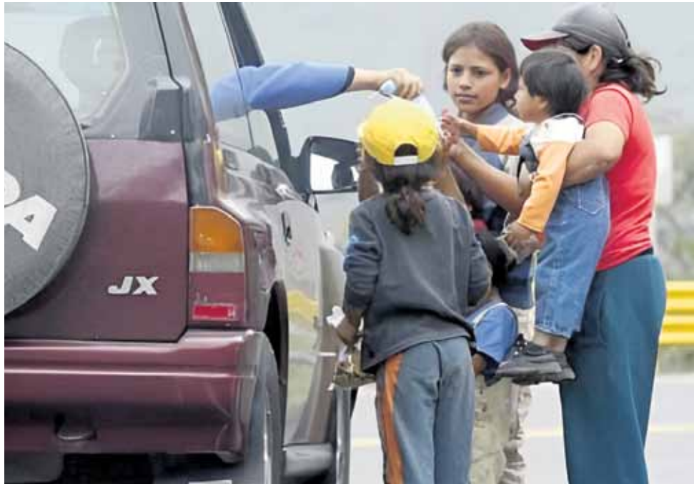
BRECHAS. Se retrocedería a la tasa de pobreza de prepandemia en 2030, según el Gobierno.

PERSPECTIVA. Especialistas sostienen que, de aplicarse un impuesto a la riqueza en el Perú, se reducirían las desigualdades. Recomiendan evaluar los privilegios tributarios a empresas.