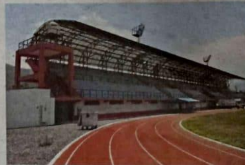
ESTADIO. Es moderno, pero muy poco usado por la población.

Yarabamba, en Arequipa, es uno de los distritos más ricos del país; sus autoridades municipales priorizaron un estadio, pero no el agua potable.