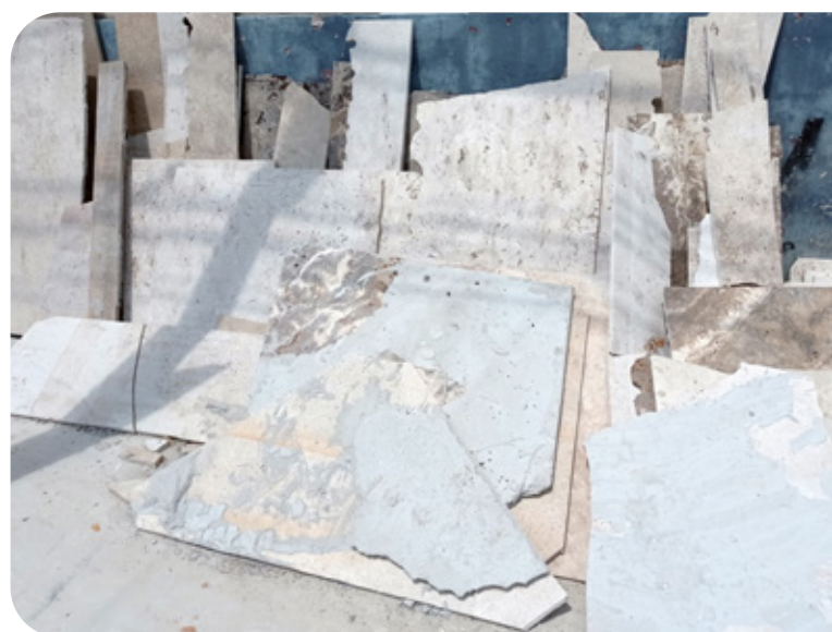
Mármol apilado en las veredas