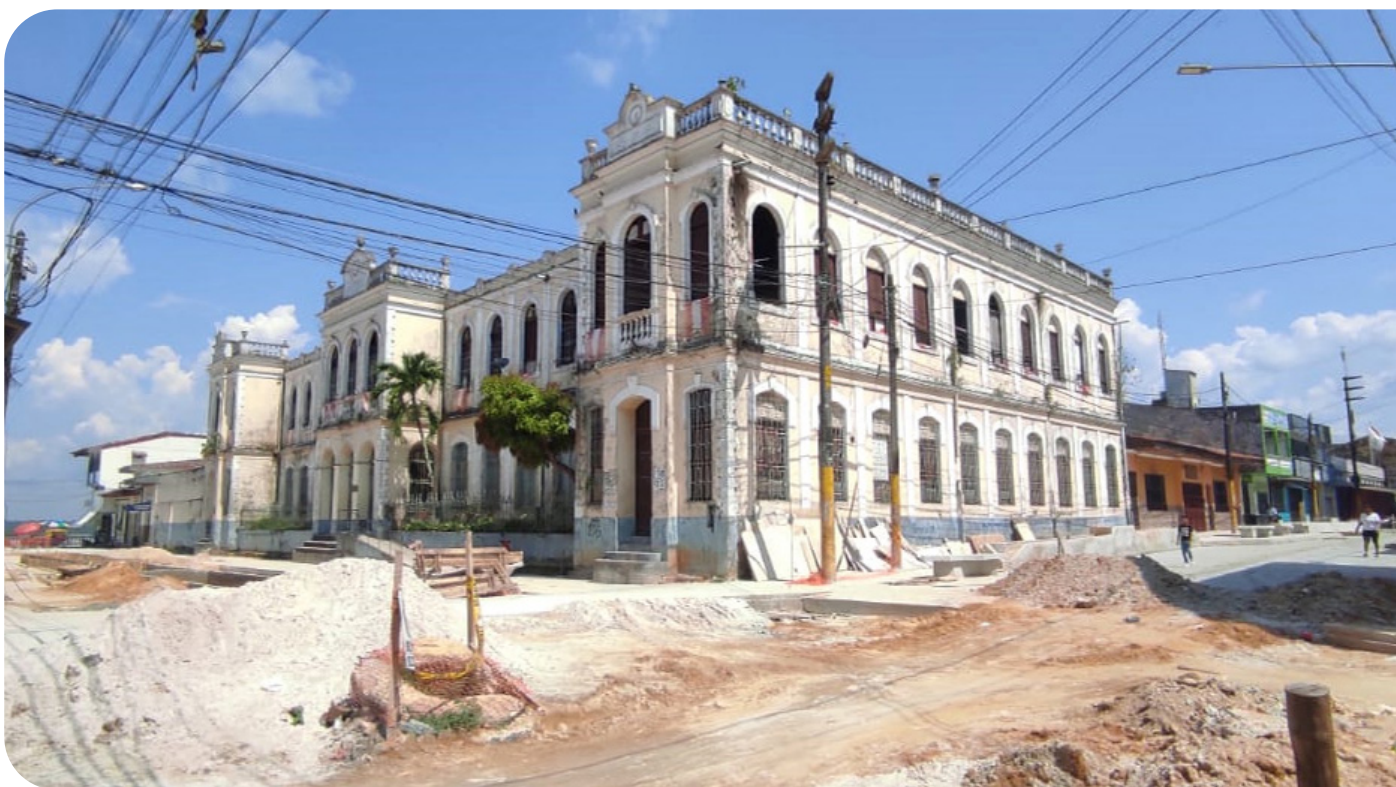
Reforzamiento de cimientos de colegio afectado por la obra