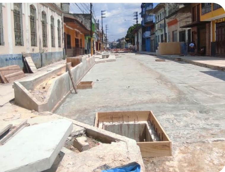
Avance de la obra

La visita pudo concretarse recién en el tercer intento, pues en los dos primeros intentos no se encontraba el ingeniero residente de obra.