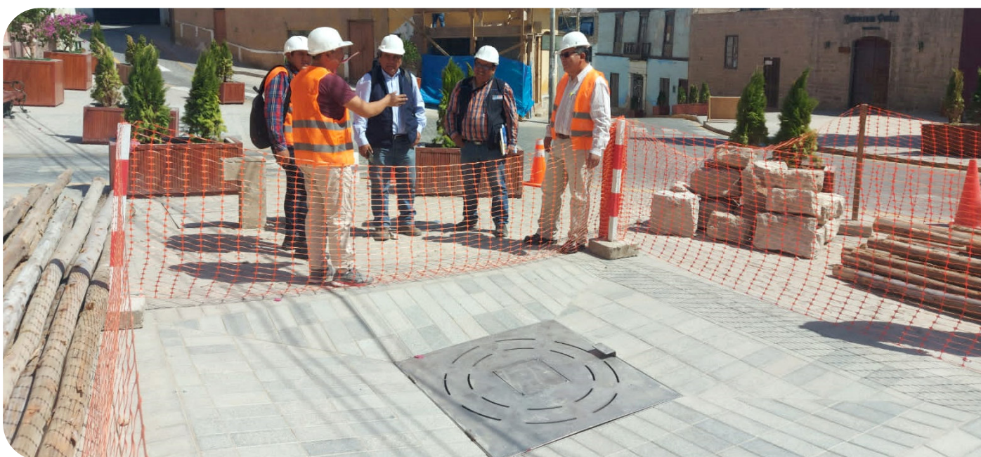
Avance de obra y juego de aguas