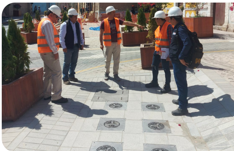
Exposición del juego de aguas

No se ha encontrado el cartel de obra después de la finalización la II Etapa del proyecto. Sin embargo, los vecinos refieren que sí hubo un cartel.