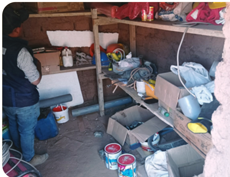
Interior de la obra

En la visita se pudo verificar que los materiales de trabajo más necesarios son precisamente los que demoran en llegar más por el retraso de las compras.