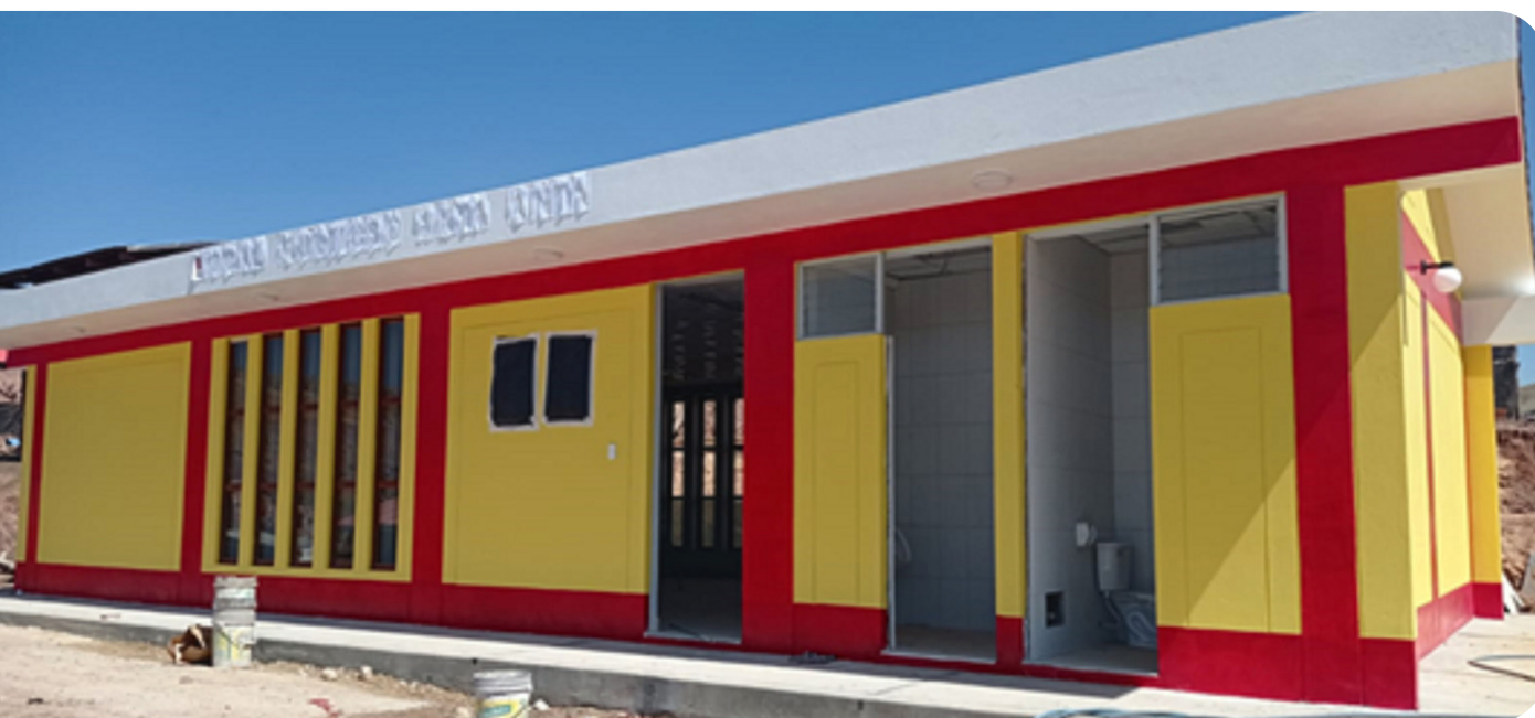
Avance de local comunal