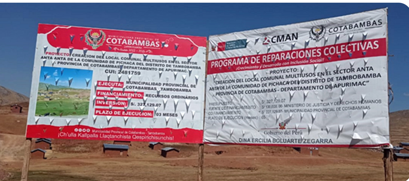
Cartel de obra