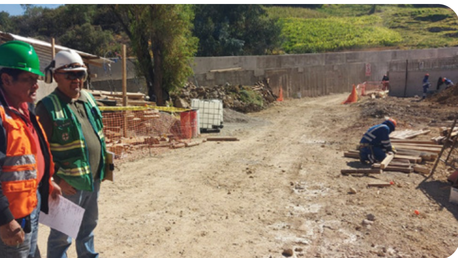
Captación de agua