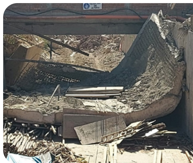
Losa de concreto armado caída