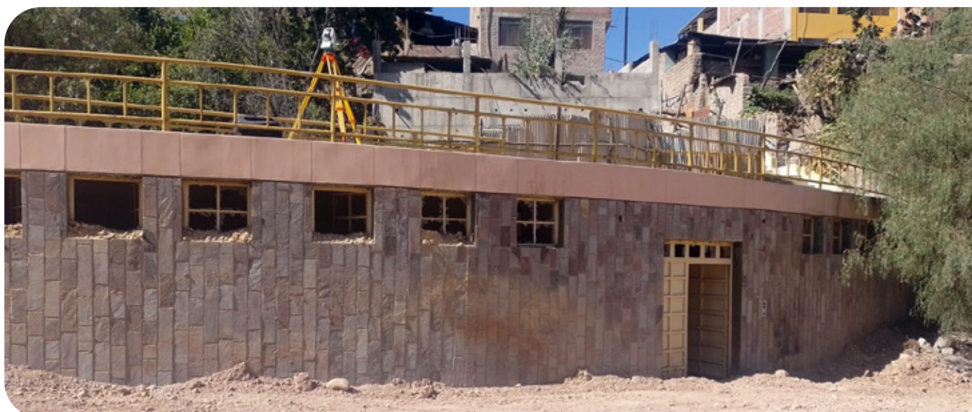
Nivel de piso con relleno

Beneficiarios: Se perjudican las propiedades colindantes. Además, la obra no concluirá en el plazo por falta de saneamiento legal.