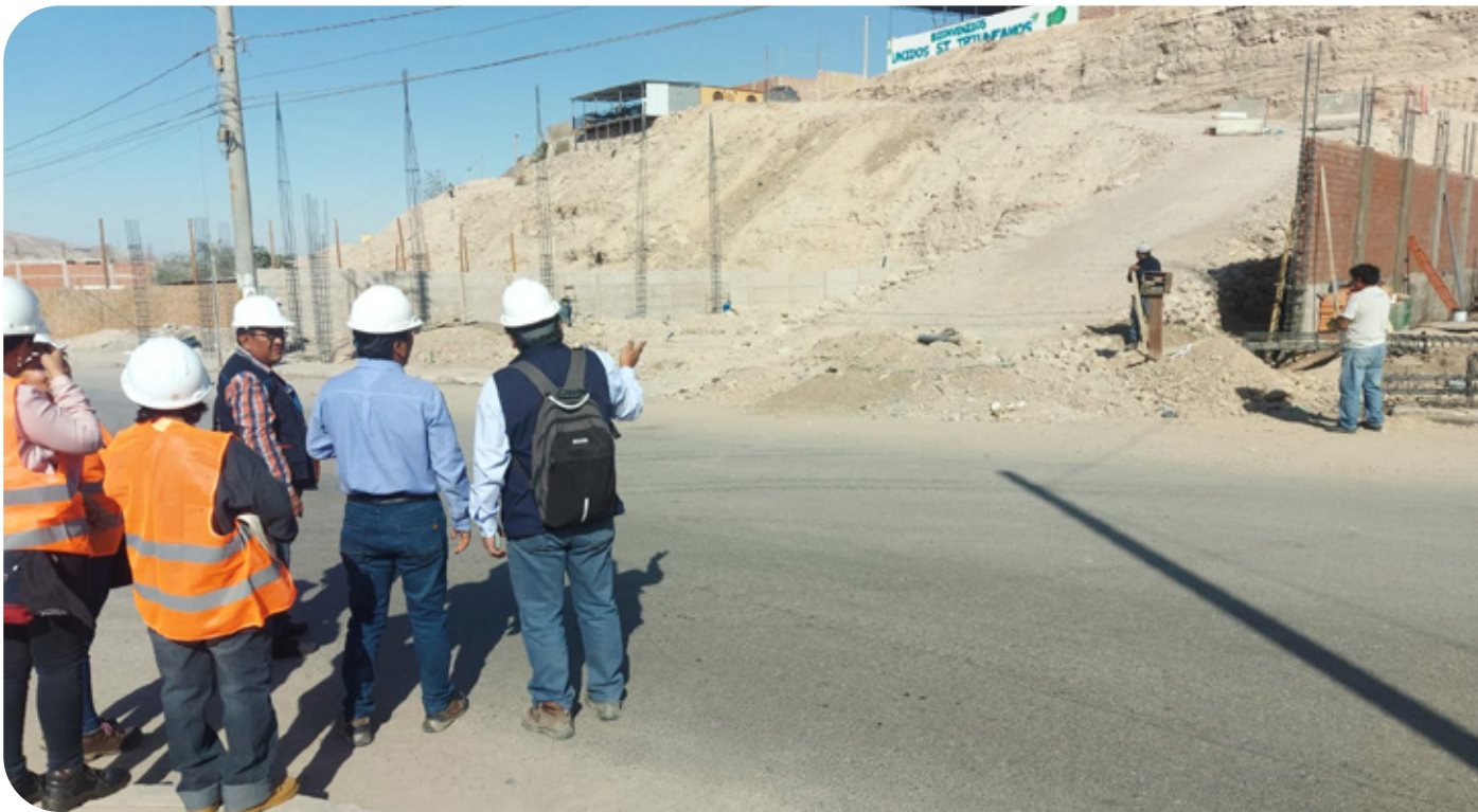
Vía en disputa con la población