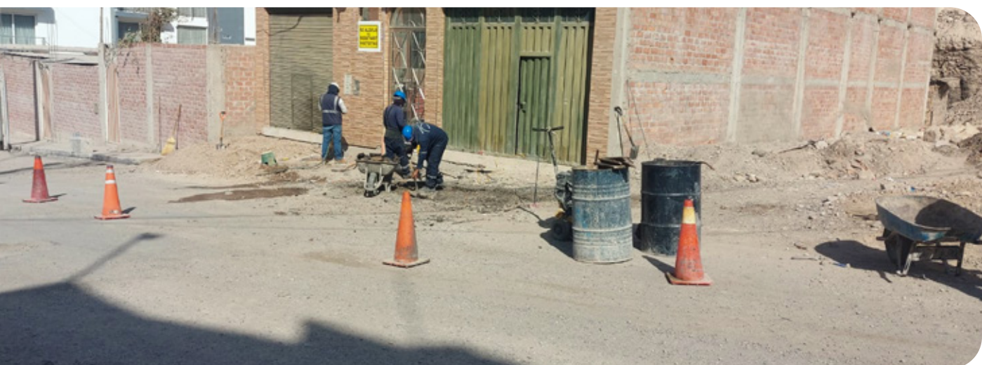
Construcción de veredas

Se corroboró el avance de la obra en los aplicativos informáticos revisados: (a) las veredas están a punto de culminarse; (b) el componente de áreas verdes no ha iniciado su ejecución, y (c) la capa asfáltica está completamente ausente y se prevé ejecutar por contrata a través de terceros.