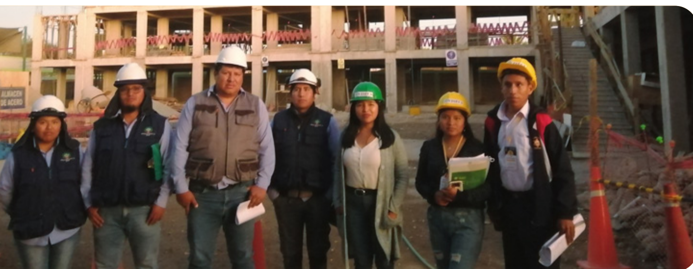
Entrevista con el ingeniero residente de obra

Realizamos una visita a la obra para contrastar la información subida en los diversos portales de transparencia del Estado. Hasta el día en que se realizó la visita, el 10 de agosto de 2023, los avances físico y financiero consignados eran de un 22% y un 39,1%, respectivamente. Estas cifras evidenciaban una brecha de 17%. No obstante, ambos avances eran distintos en la obra real: aproximadamente, 46% en el físico y 49% en el financiero. Con ello se infiere que la información en los portales de transparencia no se pone al día periódicamente. De hecho, la última actualización se dio en mayo, por lo que hasta agosto había dos meses sin que se hubiera actualizado la plataforma del SSI. Días después de la visita se actualizó el portal con un avance físico de 36,5% y uno financiero de 49,4%, con una brecha de 12%.