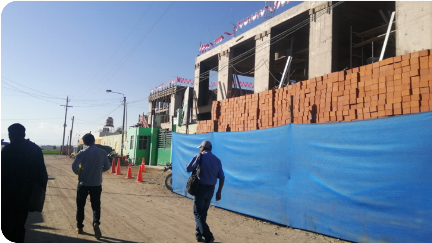
Visita a la obra con los integrantes del proyecto y de la sociedad civil

Beneficiarios: Esperan una rápida culminación de las aulas, porque las temporales son prefabricadas.