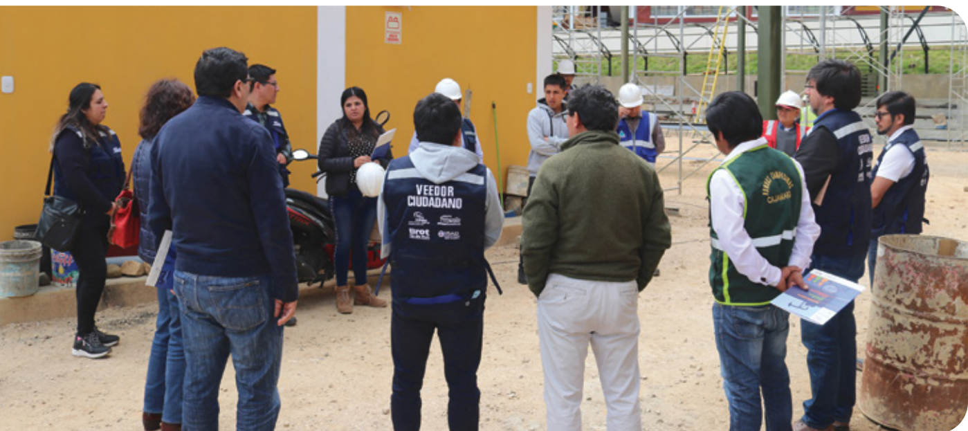
Visita no oficial a la obra