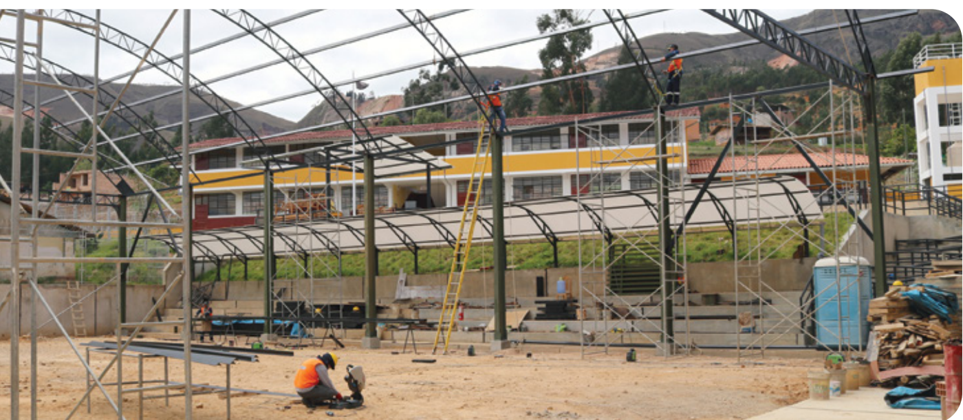
Avance de la obra

Según la cláusula primera del contrato de obra, la empresa beneficiaria de la buena pro en la licitación pública 002-2022-GR.CAJ para la ejecución de la obra materia de vigilancia fue el Consorcio y Consultor del Norte, integrado por Servicios Generales Gra S. R. L. y A & S. Ingeniería y Construcción S. A. Sin embargo, la resolución 2295-2022-TCE-S4 del Tribunal de Contrataciones del Estado resolvió revocar la buena pro y otorgarla al postor Consorcio Agocucho, integrado por las empresas Demaro S. R. L. y Macsell Contratistas Generales S. R. L. La mencionada revocatoria se dio luego de que el Consorcio Agocucho impugnara los poderes del Consorcio y Consultor del Norte y se hubiera demostrado que este había presentado documentación fraguada.