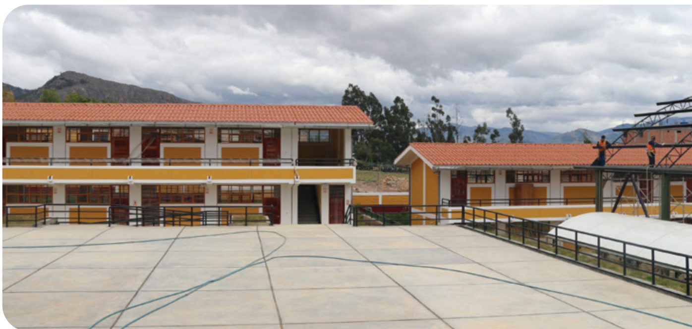
Avance de la obra