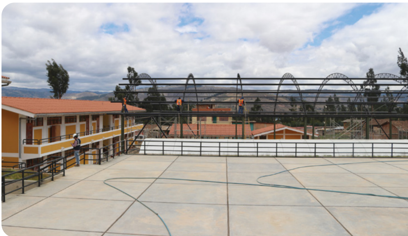
Obra paralizada para ajustar metraje de construcción de losa deportiva