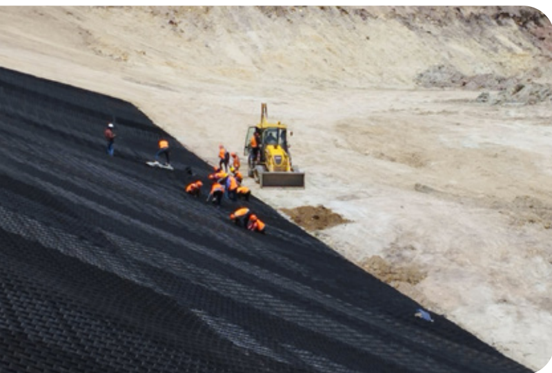
Qocha Pampa Gualtes