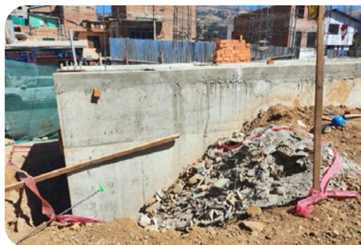
Obra en estado de abandono