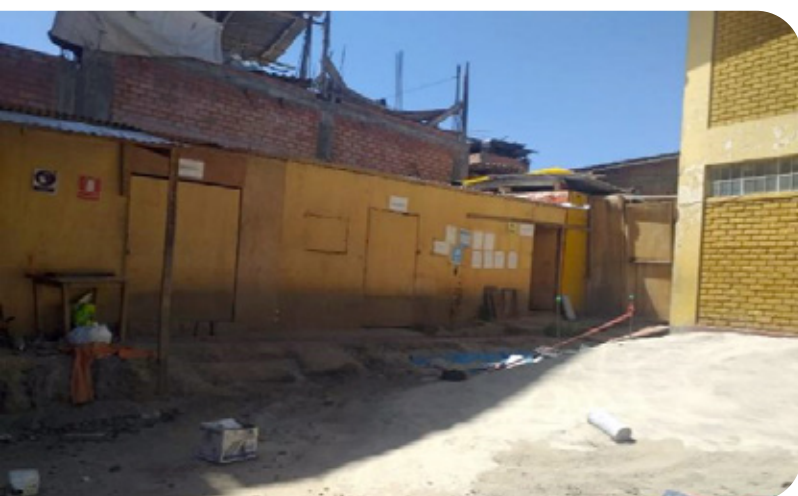
Ambiente administrativo del colegio