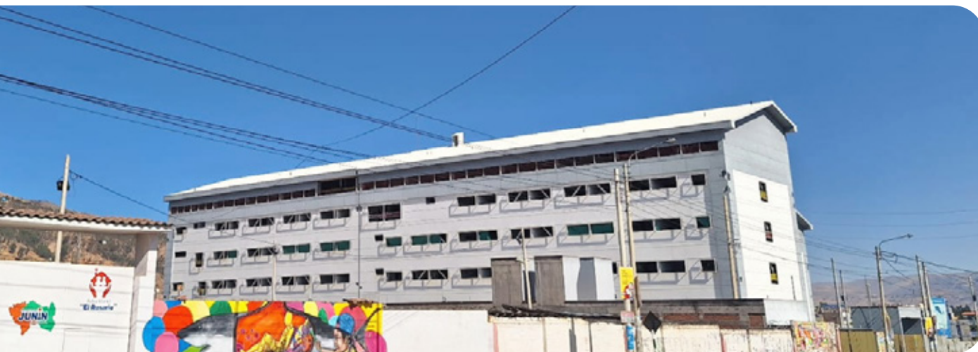
Vista lateral de los pabellones de la obra paralizada

Beneficiarios: Algunos creen que la obra recién se está construyendo, otros opinan que nunca va a culminarse, pero la mayoría desconoce que se está construyendo un nuevo local para el Hospital El Carmen.