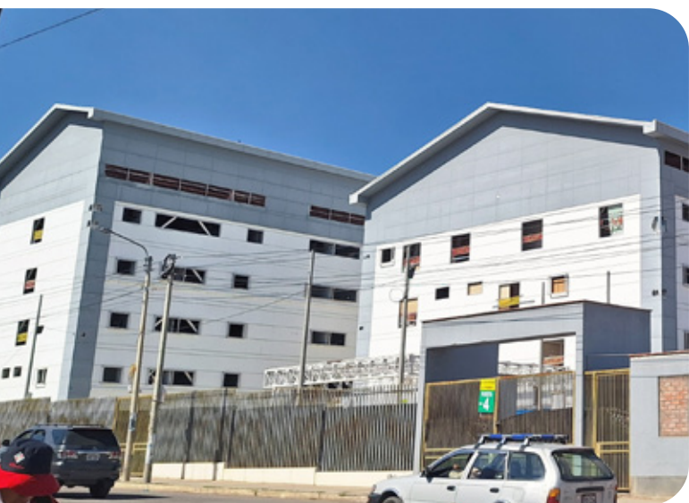
Pabellones de la obra paralizada

Haciendo caso de sus demandas, una segunda solicitud se ingresó el 18 de agosto de 2023. Esta vez se contó con el respaldo del Grupo Propuesta Ciudadana y de Foro Salud, la solicitud consignó el marco nor-