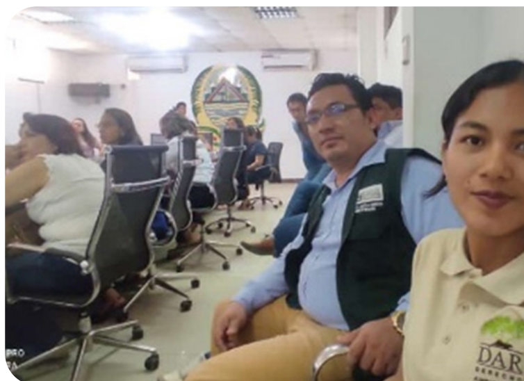
Visita a sala de actos del Gobierno Regional de Ucayali

El proyecto intenta enfrentar el problema de la anemia y desnutrición crónica infantil en Ucayali, una de las regiones con mayor cantidad de casos en el Perú. Según el SSI, su ejecución alcanza, hasta diciembre del 2022, un devengado mayor a los cinco millones de soles, pero no se constata indicadores positivos a favor de los niños de la región.