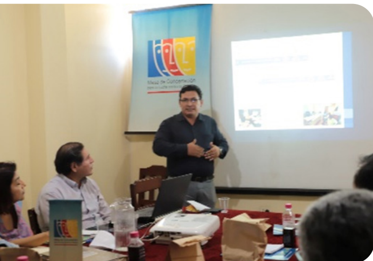
Segunda visita a Consejero Regional