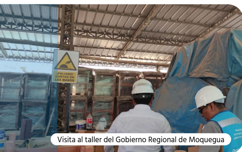
Visita al taller del Gobierno Regional de Moquegua