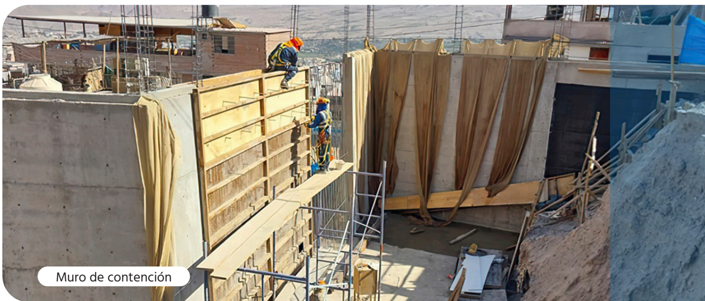
Muro de contención