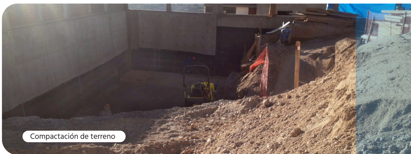
Compactación de terreno