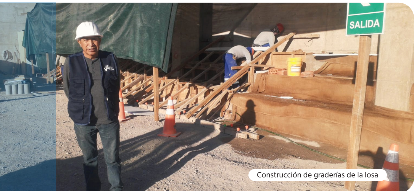
Construcción de graderías de la losa