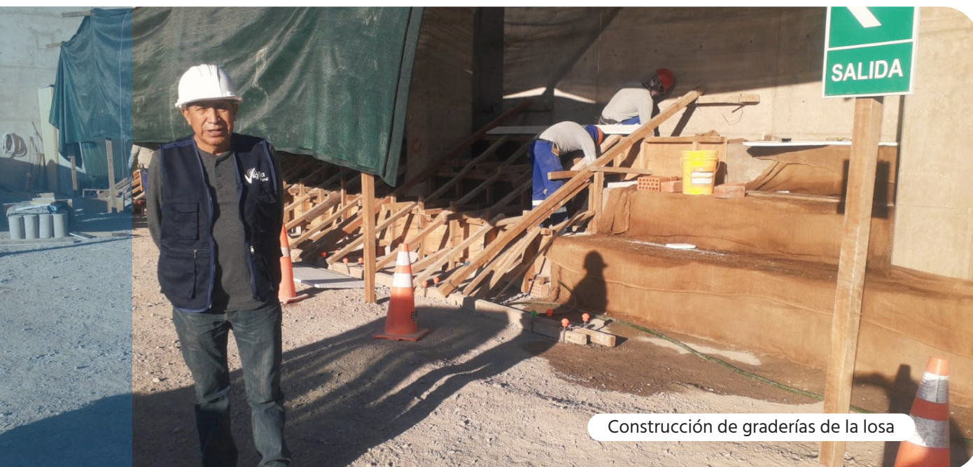
Construcción de graderías de la losa