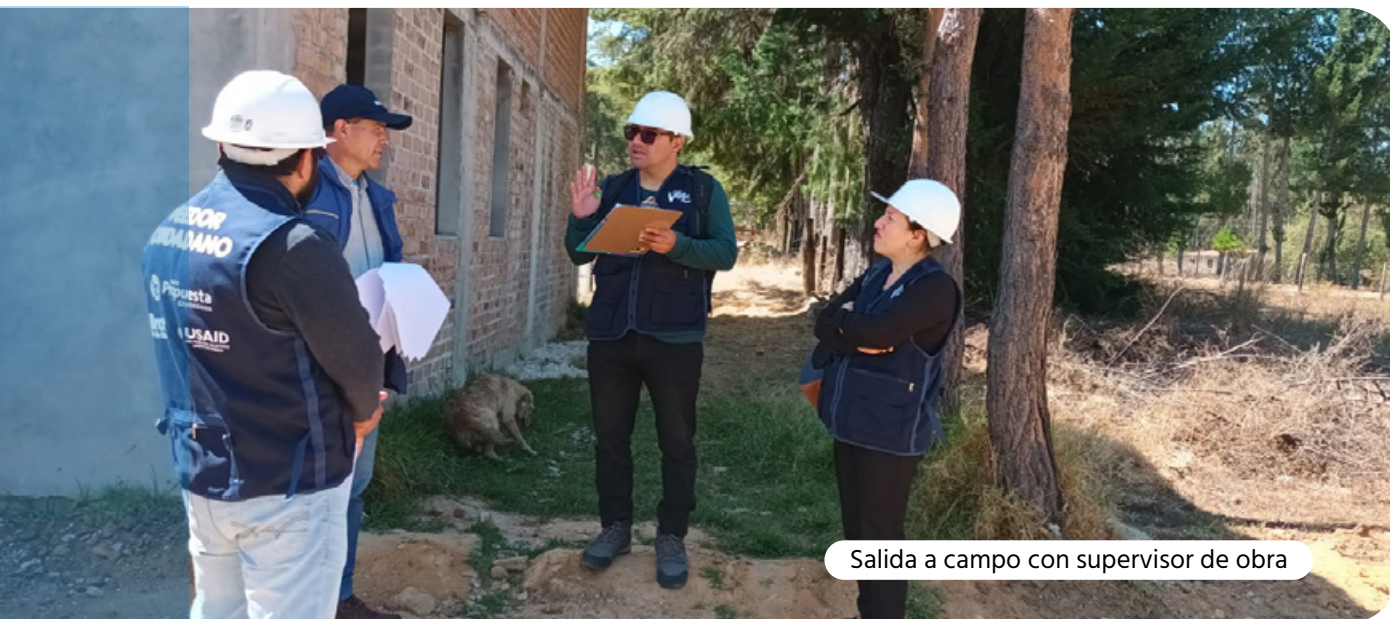
Salida a campo con supervisor de obra