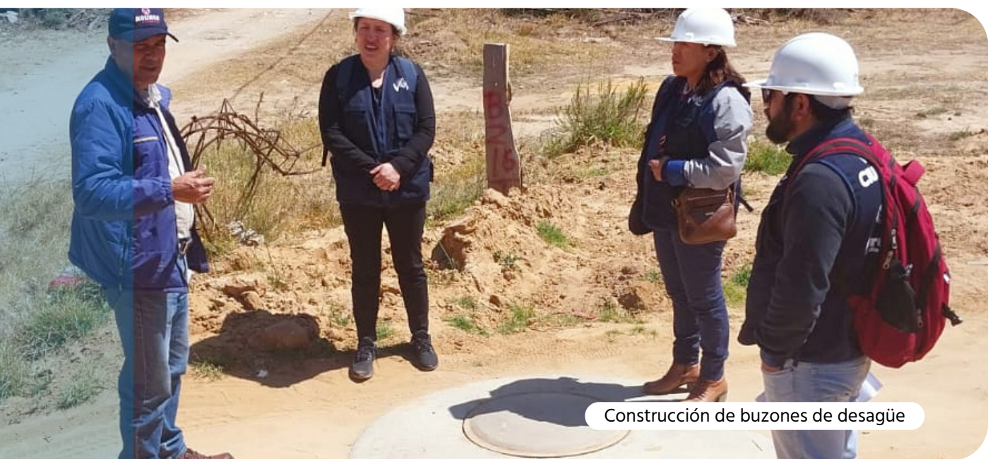
Construcción de buzones de desagüe

Finalmente, el 04/03/2024 el Comité de Selección adjudicó la Buena Pro —con la Adjudicación Simplificada AS-SM-4-2023-MDN/CS-1— para la contratación de ejecución de obra a la