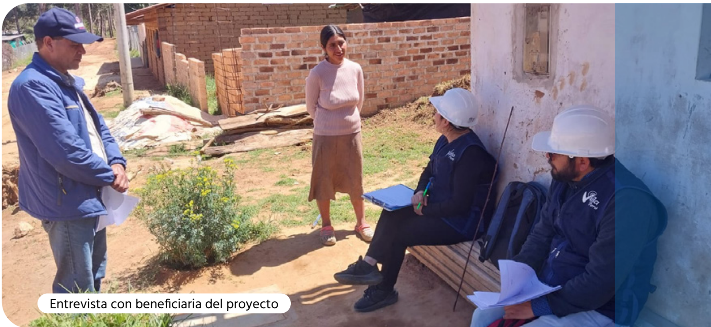
Entrevista con beneficiaria del proyecto