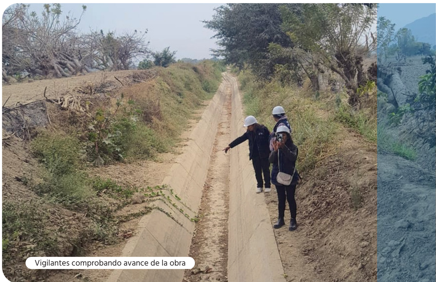
Vigilantes comprobando avance de la obra

En el siguiente enlace se ubican los documentos y fotografías relacionados al proceso de vigilancia realizado por nuestro equipo: https://bit.ly/ELTAMBOYMOLINO