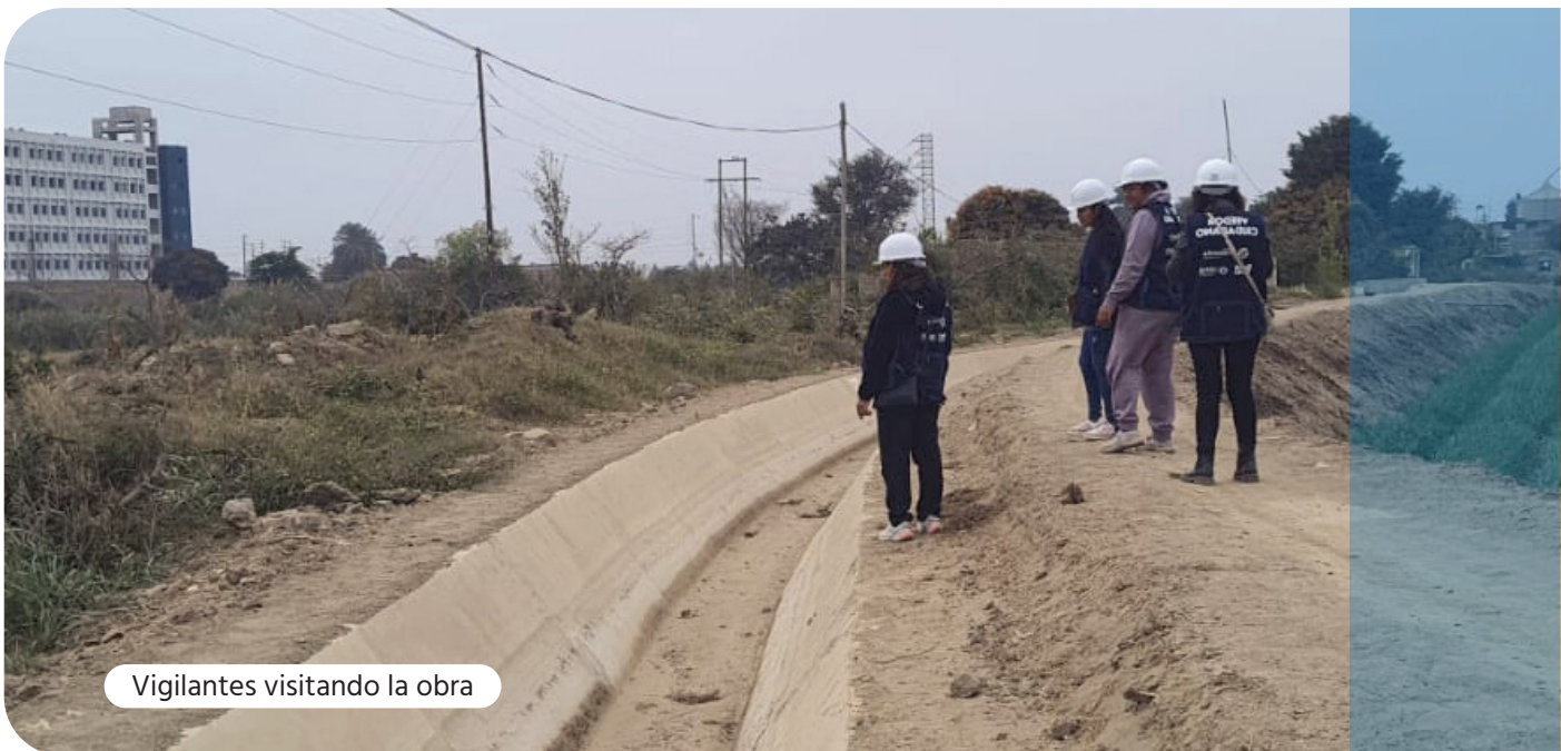
Vigilantes visitando la obra