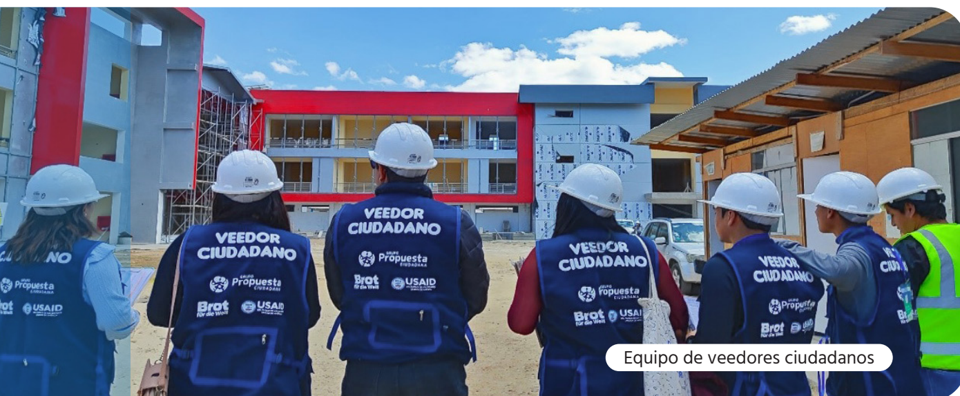
Equipo de veedores ciudadanos