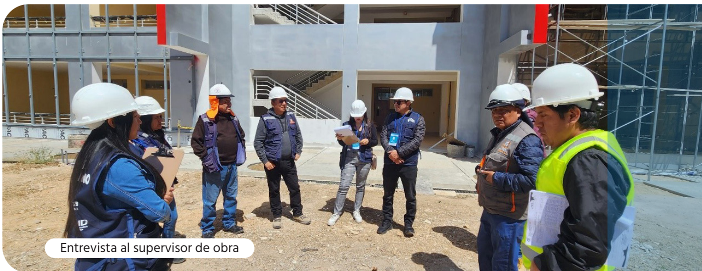
Entrevista al supervisor de obra