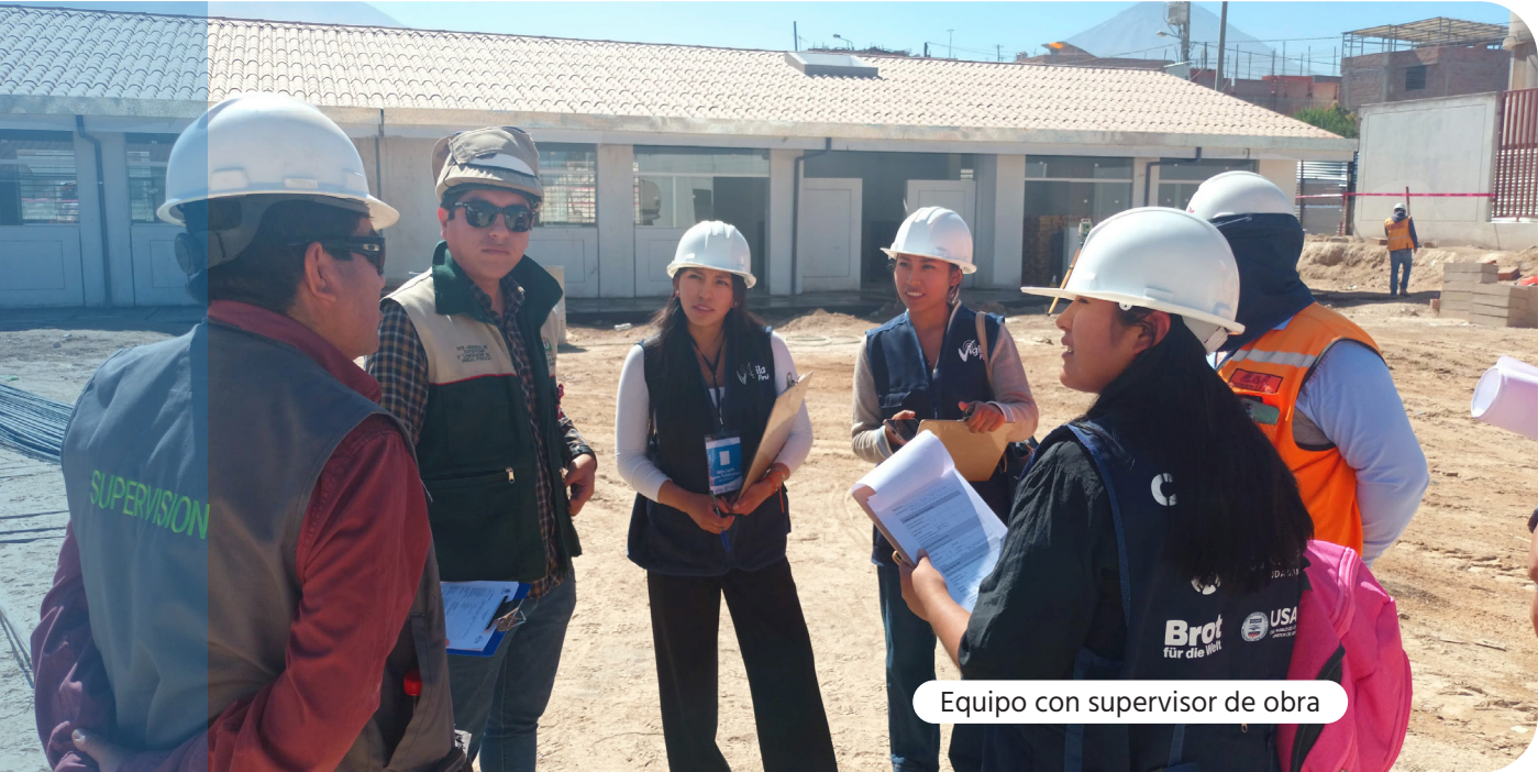
Equipo con supervisor de obra